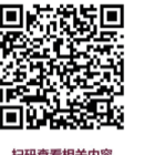
扫码查看相关内容