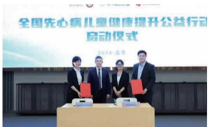
阜外医院与爱佑慈善基金会签署战略合作协议

此次公益行动旨在落实党的二十届三中全会精神，践行健康优先发展战略，助推我国出生缺陷三级预防体系建设，通过发挥心血管领域“国家队”作用、充分借助慈善组织和互联网公益平台力量，整体提升先心病儿童健康水平，真正帮助更多家庭经济困难的先心病儿童看得上病、看得起病、看得好病。