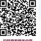
扫码查看相关内容