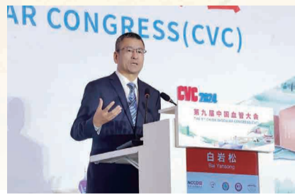
白岩松先生发表演讲