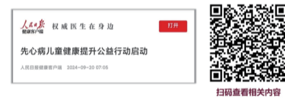
扫码查看相关内容