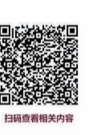
扫码查看相关内容