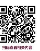
扫码查看相关内容