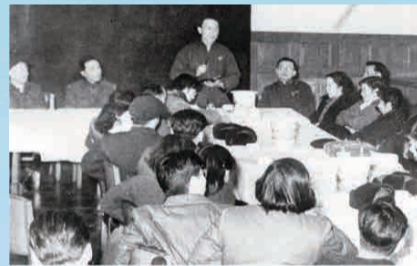
黄宛召开冠心病协作研究会